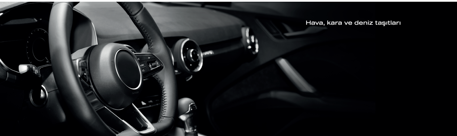
Hava, kara ve deniz taşıtları