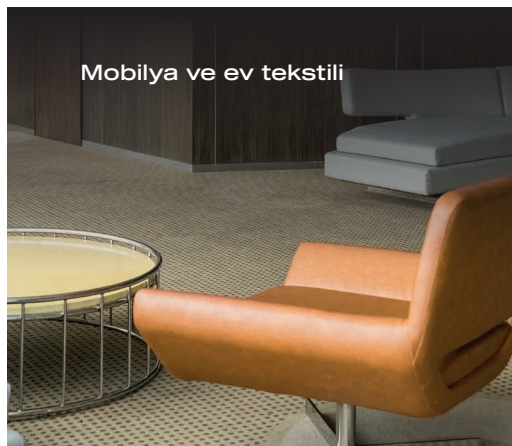
Mobilya ve ev tekstili