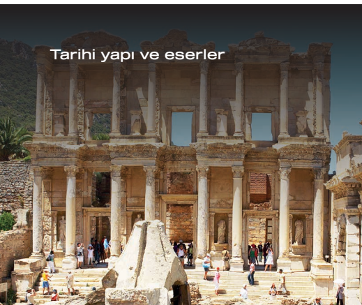
Tarihi yapı ve eserler