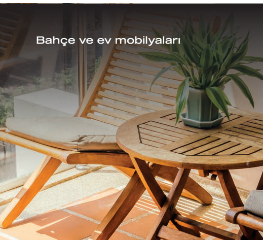
Bahçe ve ev mobilyaları