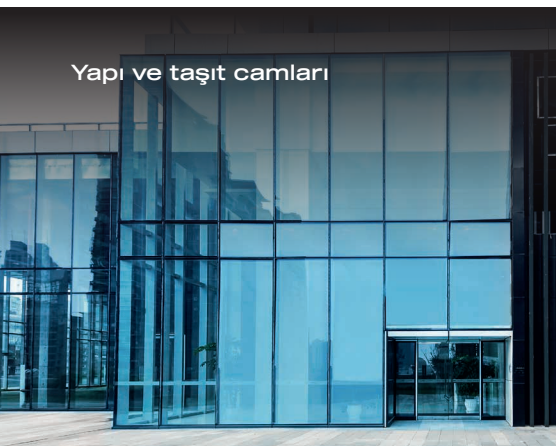
Yapı ve taşıt camları